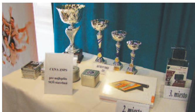
Putovný pohár ZSPS a ceny od partnerov súťaže