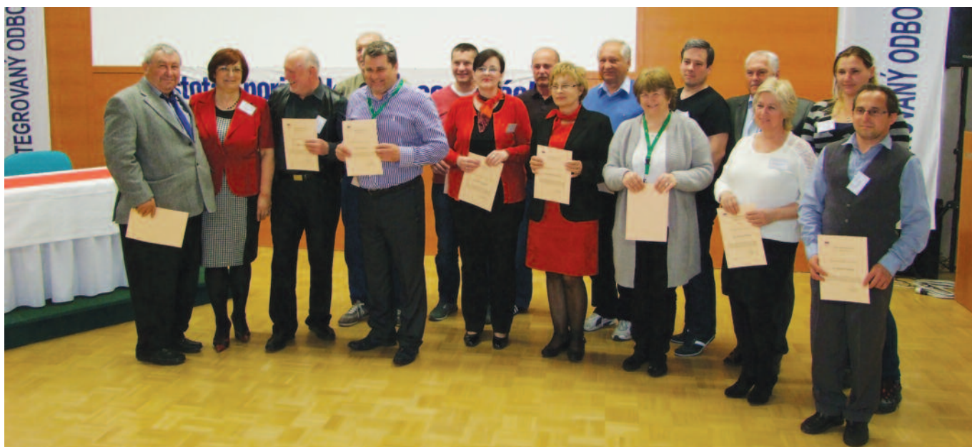
Pedágovia súťažiacich škôl s Ďakovnými listami IOZ