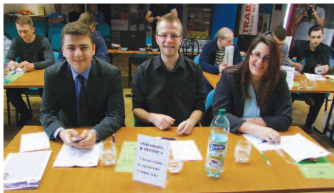
Žiaci zo Spojenej školy Kremnička Banská Bystrica