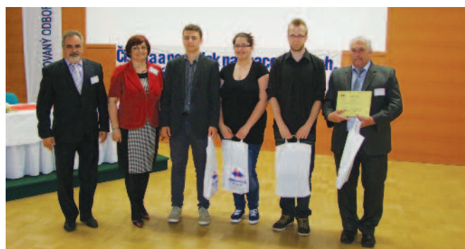
3. miesto - Spojená škola Kremnička Banská Bystrica s prezidentom KOZ SR