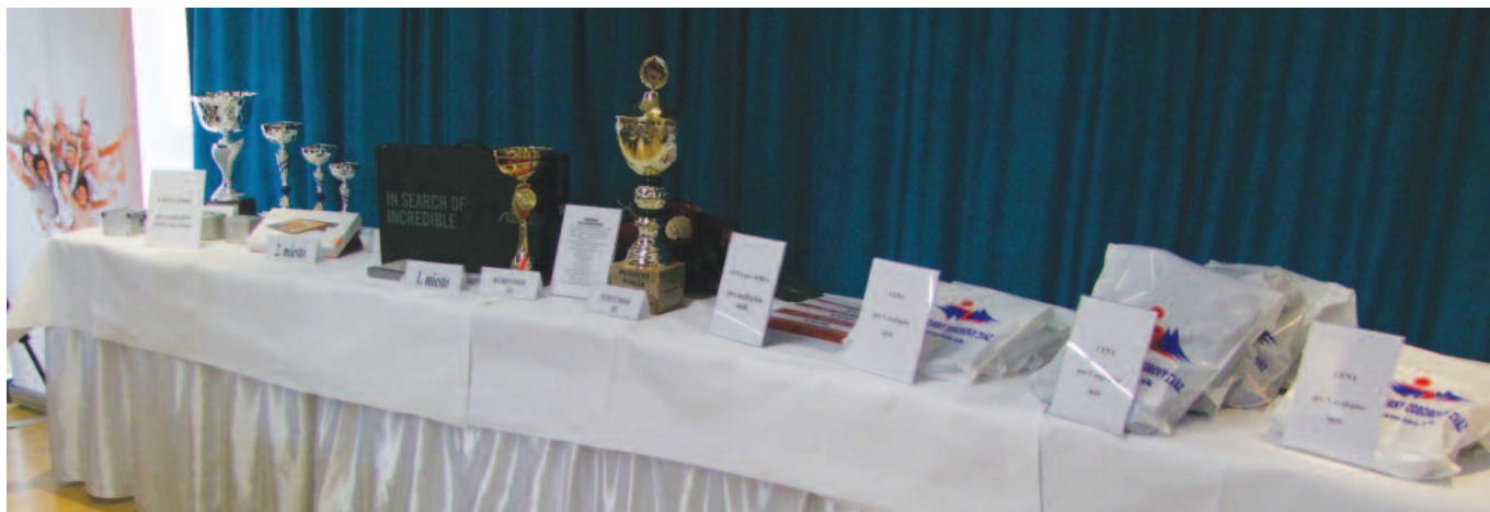
Ceny pre víťazov súťaže